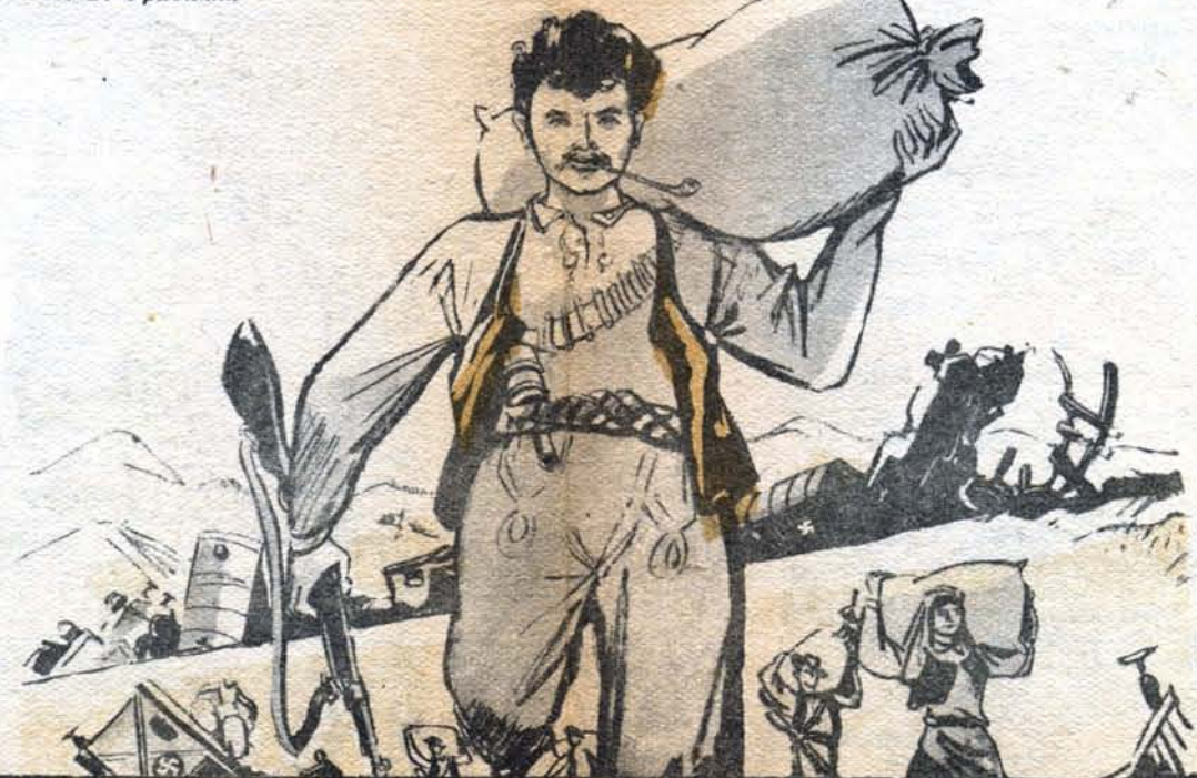
Рис. Б. Фридкина

— Молодцы наши партизаны! Наладили работу транспорта. Продовольствие прибыло своевременно.