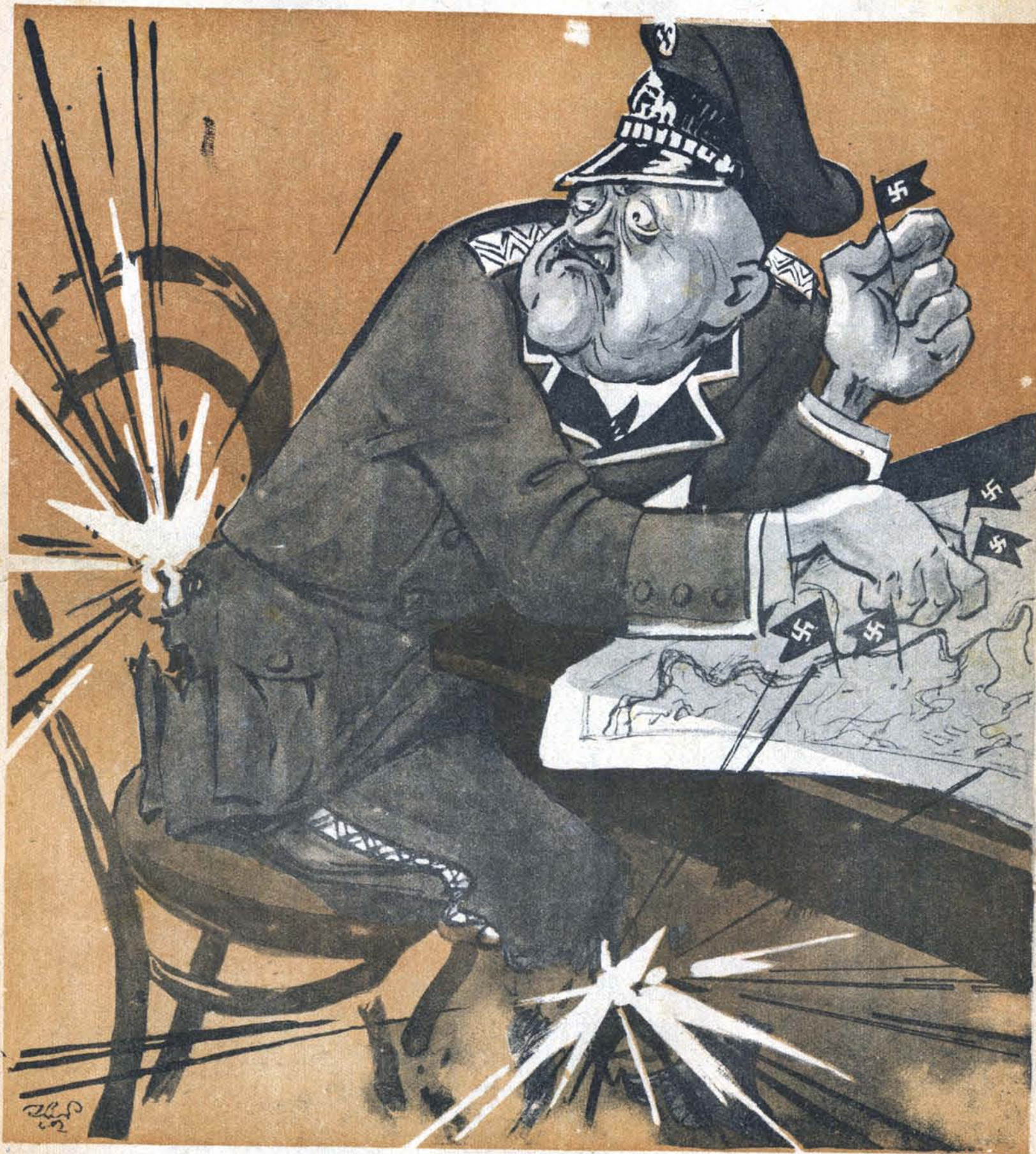
Рис. К. Елисеева

— Удивительно упорный народ эти русские: как я с ними ни бился, никак не мог уговорить их, что мы должны победить.