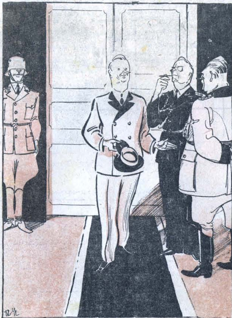
Рис. Б. Клинка