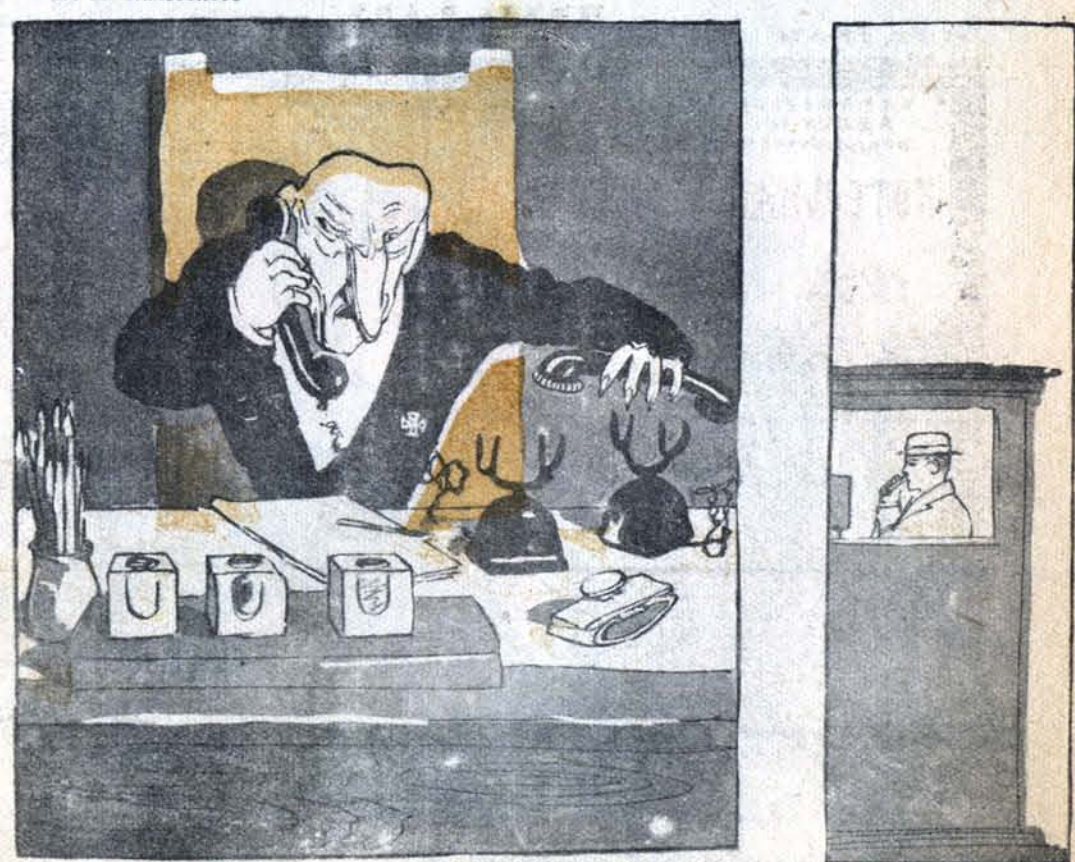
Рис. А. Каневского

— Вы предатели и холуи!.. — Алло! Кто говорит? — Все говорят.